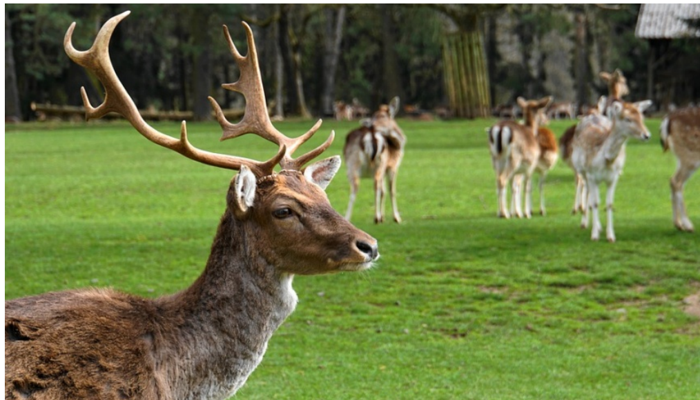
Damwild im Gehege

m/s 7. Februar 2019 Bezirk, Natur, Slider