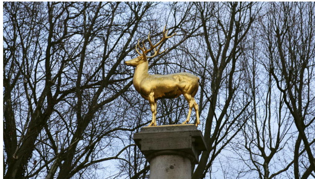
Der Goldene Hirsch im Rudolph-Wilde-Park - Foto: Tempelhof-Schöneberg Zeitung