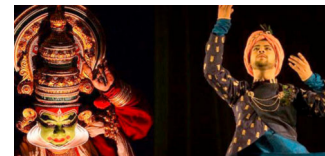
Katak und Katakali Tanz aus Indien