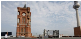
CO2-neutrale Berliner Verwaltung ist das Ziel