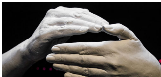
Ausstellung: Gesten – gestern, heute, übermorgen