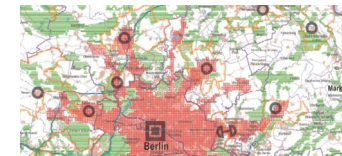
Landesentwicklungsplan Hauptstadtregion in Kraft getreten

Die Tempelhof-Schöneberg Zeitung ist politisch unabhängig und thematisiert Nachrichten aus dem Berliner Bezirk Tempelhof-Schöneberg.