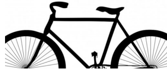
Dialogveranstaltung: Radschnellverbindung Y-Trasse