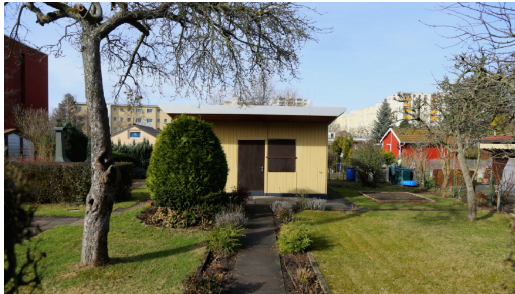
Einfach & schlicht: Kleingarten irgendwo in Berlin