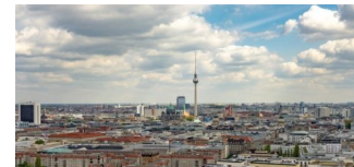
„Stadtentwicklungsplan Zentren 2030“ vom Senat beschlossen