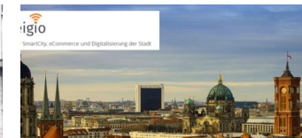
Berlin wird Smart City!

Die Tempelhof-Schöneberg Zeitung ist politisch unabhängig und thematisiert Nachrichten aus dem Berliner Bezirk Tempelhof-Schöneberg.