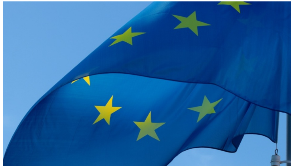
Europawahl 2019: Hohe Wahlbeteiligung in Deutschland und Berlin - Foto: pixabay

m/s 26. Mai 2019 📁 Aktuell, Berlin, Europa, Slider 📄 🖨️