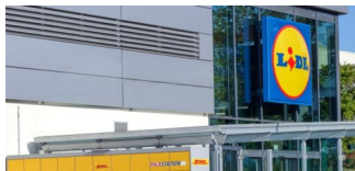
Bei Lidl einkaufen und gleich DHL Pakete abholen