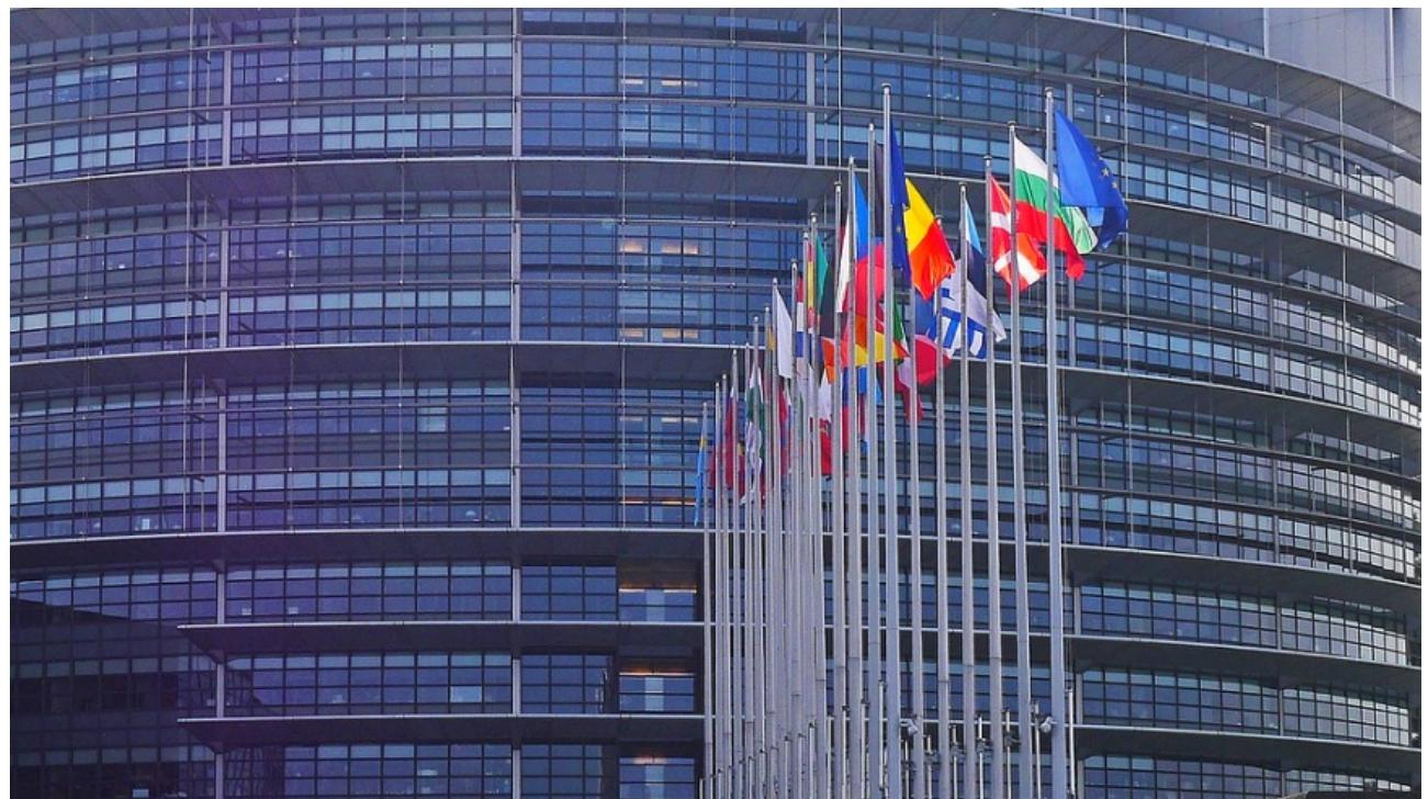
Europaparlament in Straßburg

m/s 28. November 2019 Aktuell, Europa, Slider