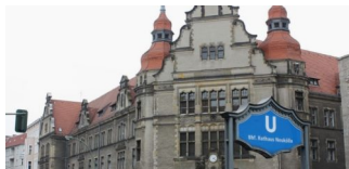
Was geht ab zwischen Tempelhof-Schöneberg und Neukölln?