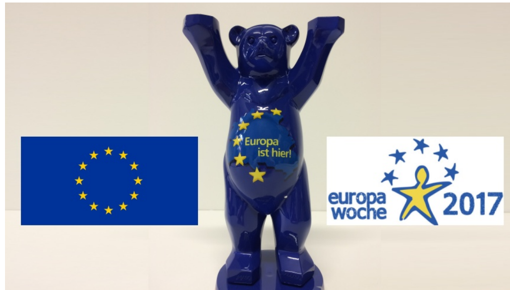
Europapreis Blauer Bär