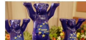
Vorschläge für die Blauen Bären 2019 gesucht!

Die Tempelhof-Schöneberg Zeitung ist politisch unabhängig und thematisiert Nachrichten aus dem Berliner Bezirk Tempelhof-Schöneberg.