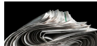
„Und der Berliner Zeitungsmarkt ... Der ist zerstört!“