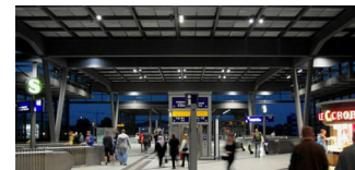
Bahnhof Südkreuz wird Testfeld für Videoanalyse-Technik