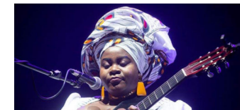
Wassermusik im HKW

Die Tempelhof-Schöneberg Zeitung ist politisch unabhängig und thematisiert Nachrichten aus dem Berliner Bezirk Tempelhof-Schöneberg.