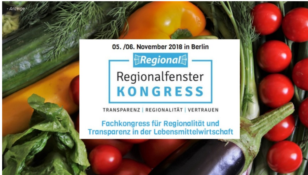
Fachkongress für Regionalität und Transparenz in der Lebensmittelwirtschaft in Berlin - Foto: pixabay

m/s 4. November 2018 Aktuell, Produktwarnung, Shopping, Slider