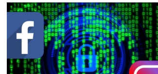
Datenpannen bei Facebook & Instagram alarmieren Börsenaufsicht