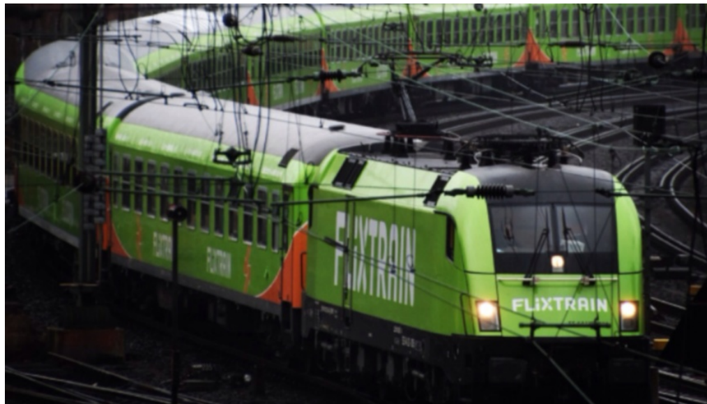
Flixtrain-Fernzug - Foto: Flixmobility GmbH

Redaktion 23. Mai 2019 Berlin, Slider, Verkehr