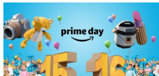
Amazon-Prime: 17,3 Mio. zufriedene Abonnenten