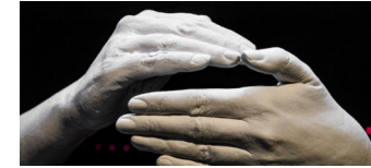
Ausstellung: Gesten – gestern, heute, übermorgen

Die Tempelhof-Schöneberg Zeitung ist politisch unabhängig und thematisiert Nachrichten aus dem Berliner Bezirk Tempelhof-Schöneberg.