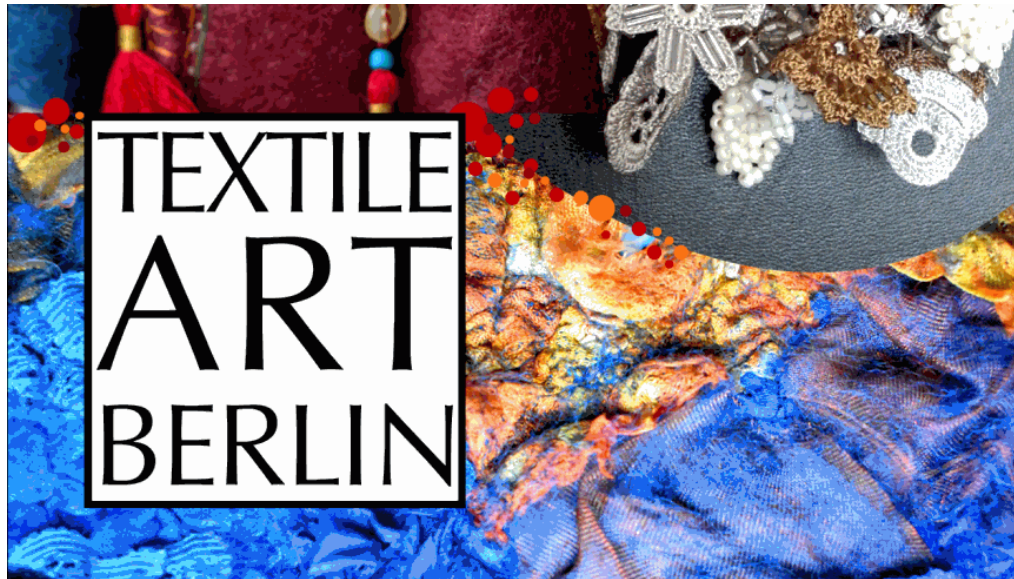
15. TEXTILE ART BERLIN: „Flying Colors – Tausend Expressionen“ - Grafikdesign: Y. K.

m/s 11. Juni 2019 Berlin, Kunst und Design, Slider, Sliderblock