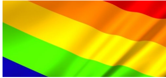
Innenverwaltung erteilt Zustimmung für Beflaggung mit Regenbogenfahne