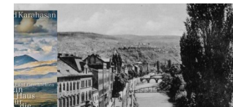
Dževad Karahasan: „Ein Haus für die Müden“

Die Tempelhof-Schöneberg Zeitung ist politisch unabhängig und thematisiert Nachrichten aus dem Berliner Bezirk Tempelhof-Schöneberg.