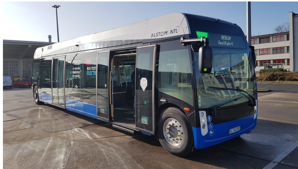
E-Bus Aptis von Alstom NTL

m/s 🕒 23. Februar 2018 Berlin, Slider, Verkehr