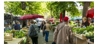
Wochenmärkte, Fair-Trade, Shopping-Nachrichten ....