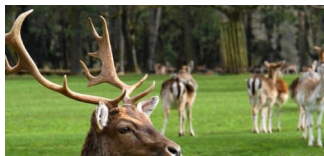
Damwild aus dem Franckepark verlegt