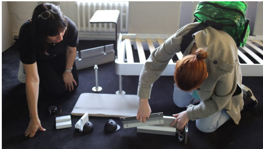
IKEAs offene Plattform „DELAKTIG“: Studenten des Royal College of Art in London montieren ihre Möbel-Ideen

MHS 23. März 2017 Kunst und Design, Slider