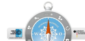
Sicherheitskompass für mehr Internet-Sicherheit

Die Tempelhof-Schöneberg Zeitung ist politisch unabhängig und thematisiert Nachrichten aus dem Berliner Bezirk Tempelhof-Schöneberg.