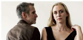
Premiere im Deutschen Theater: „Der Menschenfeind“