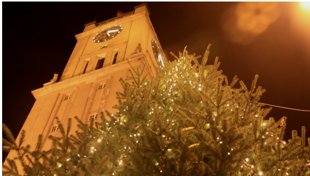
Weihnachtsbaum vor dem Rathaus Schöneberg

m/s 29. November 2017 Bezirk, Bezirkstermine, Slider