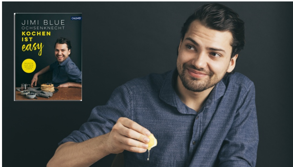
Jimi Blue Ochsenknecht beim Kochen - Buchcover: Callwey Verlag

m/s 🕒 24. September 2018 Literatur, Slider