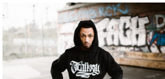
Tschüssy! Berliner Szenelabel gibt auf!