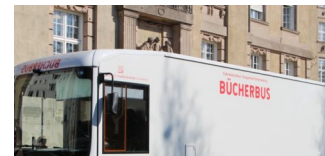
Tempelhof-Schöneberg hat einen neuen Bücherbus