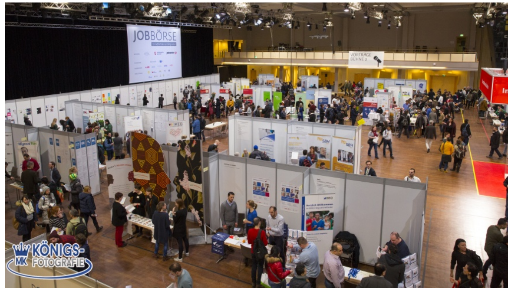
3. Jobbörse für Geflüchtete und Migranten im Estrel Convention Center in Neukölln - Foto: Netzwerk Großbeerstraße / Königs Fotografie

m/s 16. Februar 2018 Bezirkstermine, Slider, Wirtschaft