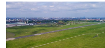
Tempelhofer Freiheit ohne Kassenhäuschen

Die Tempelhof-Schöneberg Zeitung ist politisch unabhängig und thematisiert Nachrichten aus dem Berliner Bezirk Tempelhof-Schöneberg.