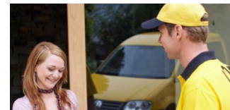
Neue Briefpreise ab 1. Juli 2019 genehmigt