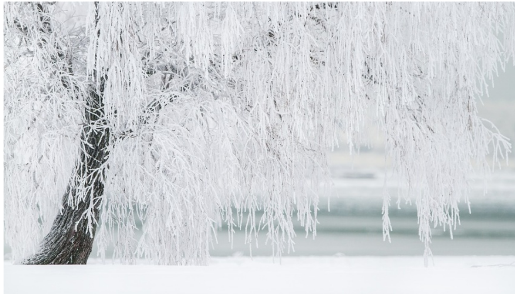
Im Winter in Parks und Gärten ist Glättegefahr