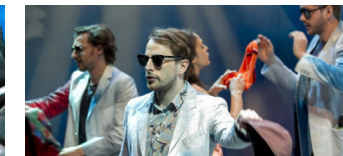
Junges Schauspiel Düsseldorf zu Gast

Die Tempelhof-Schöneberg Zeitung ist politisch unabhängig und thematisiert Nachrichten aus dem Berliner Bezirk Tempelhof-Schöneberg.