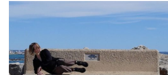
Galerie GEDOK Berlin lädt ein zum ARTIST TALK

Die Tempelhof-Schöneberg Zeitung ist politisch unabhängig und thematisiert Nachrichten aus dem Berliner Bezirk Tempelhof-Schöneberg.