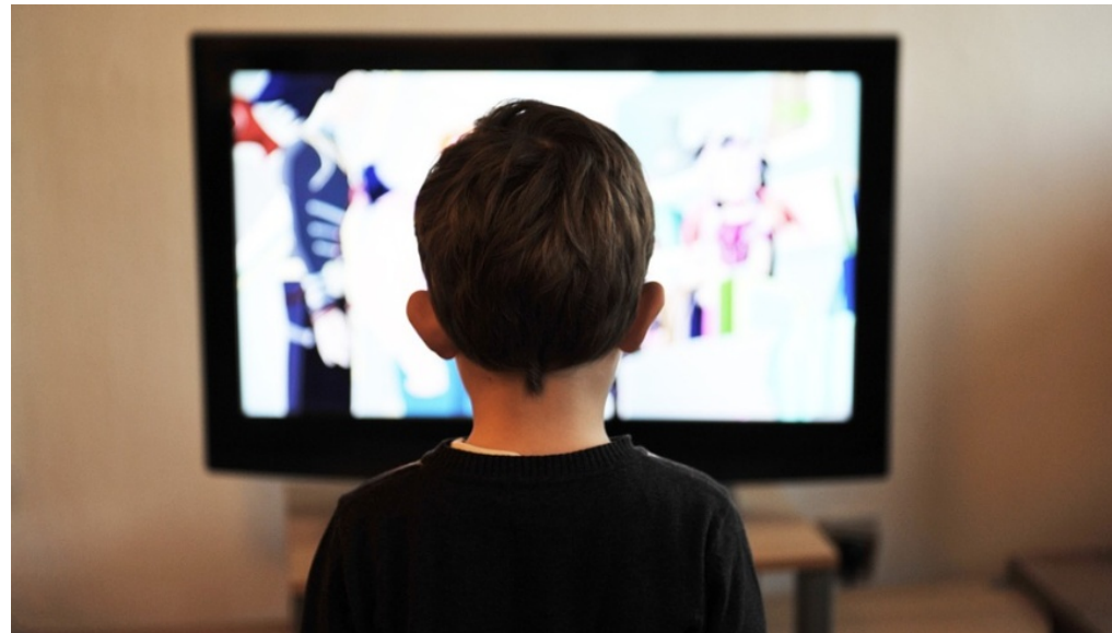
Zwei Stunden täglich vor dem Schirm beeinträchtigt die kognitive Entwicklung von Kindern - Foto: pixabay

m/s 🕒 28. September 2018 Familie, Leben, Slider, Themen