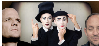
CELLO-CINEMA: Pantomime Theater und Cinemascope