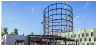
urban mobility day 15. Juni 2019