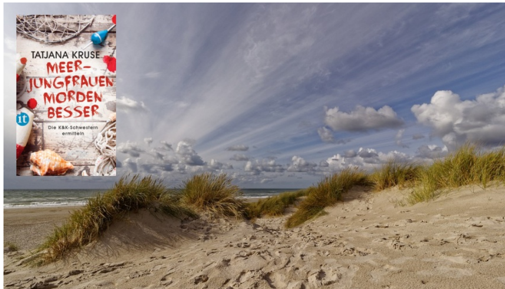
Meerjungfrauen morden besser - ein Buch aus dem hohen Norden - Foto: pixabay, Buchcover suhrkamp/insel