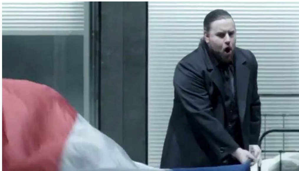
Filmstil aus "100 Sekunden mit: Enrique Mazzola" (youtube)