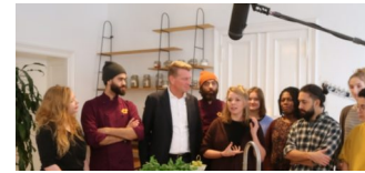
REWE übergibt 100.000 Euro-Spende an „Über den Tellerrand e.V.“