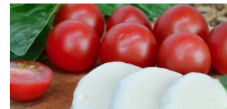
Mozzarella mit Titandioxid gefährdet Darmgesundheit