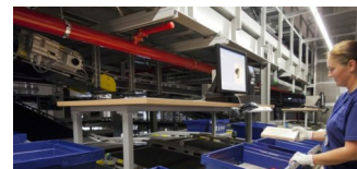
Buchlogistiker KNV-Gruppe von Berliner Unternehmen gerettet