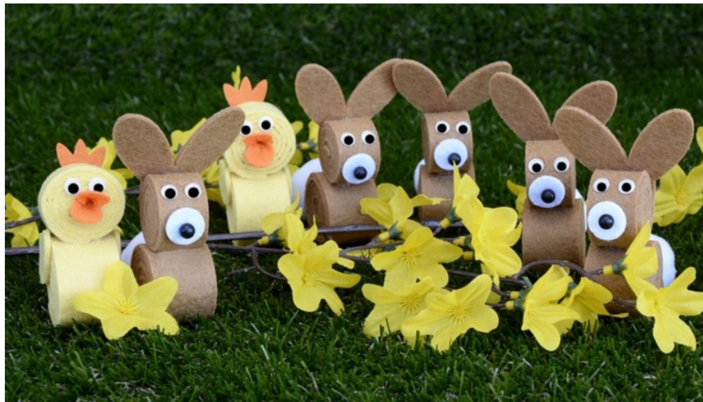
Oster-Bastelaktion in Lichtenrade

m/s 29. März 2019 ➤ Aktuell, Berlin, Familie, Shopping, Slider 📄 🖨