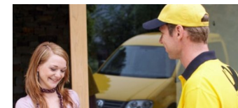
Neue Briefpreise ab 1. Juli 2019 genehmigt