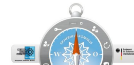
Sicherheitskompass für mehr Internet-Sicherheit