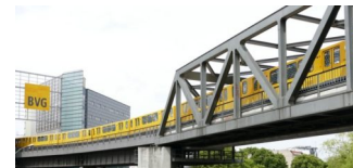
Warnstreik bei der BVG am 15.2.2019