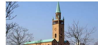
Kulturpolitischer Salon „Wir müssen reden! Aber mit wem? Und wie?“

Die Tempelhof-Schöneberg Zeitung ist politisch unabhängig und thematisiert Nachrichten aus dem Berliner Bezirk Tempelhof-Schöneberg.