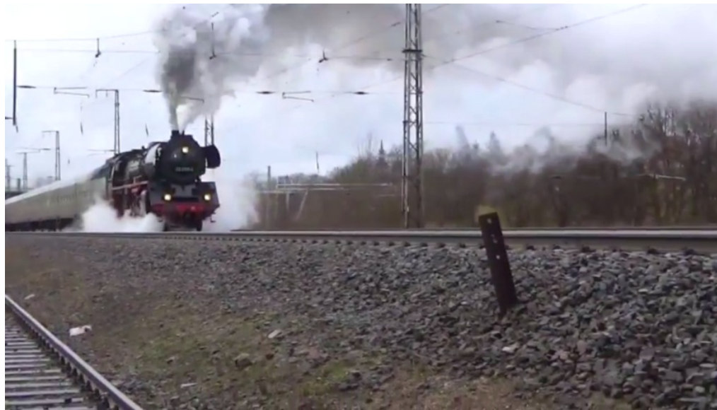
Dampflok fahren in Berlin - die Dampflokfreunde laden ein zur Rundfahrt!