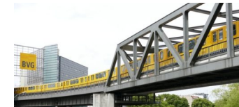
Warnstreik bei der BVG am 15.2.2019