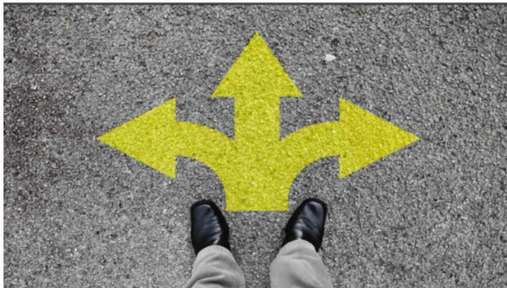
Wohin geht Ihre Werbung? Der Leitfaden zum Werbekodex des Deutschen Werberats hilft den richtigen Weg zu finden