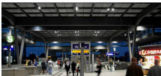
Bahnhof Südkreuz wird Testfeld für Videoanalyse-Technik