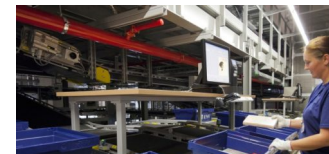
Buchlogistiker KNV-Gruppe von Berliner Unternehmen gerettet

Die Tempelhof-Schöneberg Zeitung ist politisch unabhängig und thematisiert Nachrichten aus dem Berliner Bezirk Tempelhof-Schöneberg.