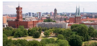
Sieben Schnellläuferprojekte des Senats erfolgreich abgeschlossen