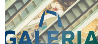
GALERIA.de – GALERIA Karstadt Kaufhof gemeinsam online

Die Tempelhof-Schöneberg Zeitung ist politisch unabhängig und thematisiert Nachrichten aus dem Berliner Bezirk Tempelhof-Schöneberg.