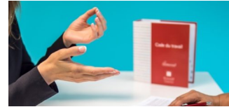
Beratung für Mieter_innen in Lichtenrade