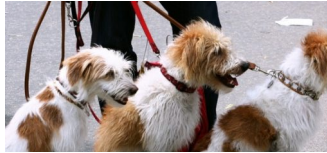
Verbraucherschutzgebührenordnung zum Hundegesetz