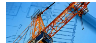
Berlin bekommt eine neue Wohnungsbau-Frage!