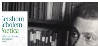
Buchpräsentation: Gershom Scholem: „Poetica“