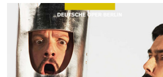
Don Quixotte in der Deutschen Oper Berlin