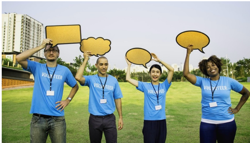
Denken Bürger noch selbst? Oder lösen NGO's, Lobbys, ThinkTanks, Stiftungen und soziale Medien unsere Parteien und Parlamente ab?