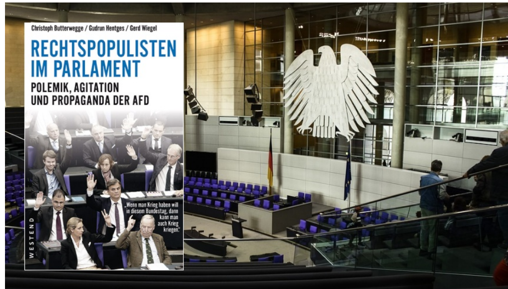
Christoph Butterwegge, Gudrun Hentges, Gerd Wiegel: Rechtspopulisten im Parlament - Foto: pixabay, Buchcover

Michael Springer 7. November 2018 Literatur, Slider