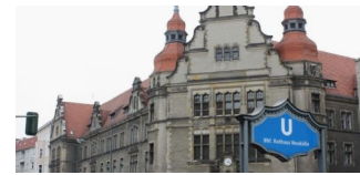
Was geht ab zwischen Tempelhof-Schöneberg und Neukölln?