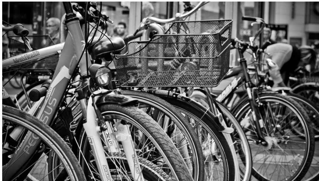
Fahrräder im Fahrradlager

m/s 12. Dezember 2017 Berlin, Polizeimeldungen