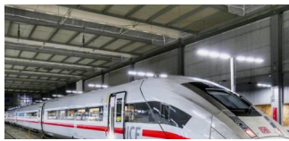
Verkehrsminister will Fernverkehr billiger machen