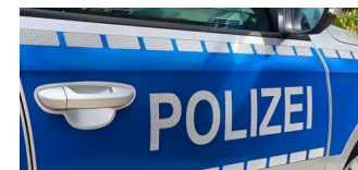
Polizeibericht vom 15.07.2019

Die Tempelhof-Schöneberg Zeitung ist politisch unabhängig und thematisiert Nachrichten aus dem Berliner Bezirk Tempelhof-Schöneberg.