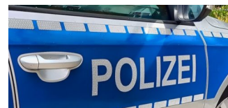
Polizeibericht vom 02.05.2019