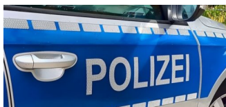
Polizeibericht vom 28.05.2019