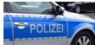
Polizeibericht vom 08.04.2019