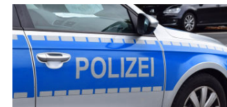
Polizeibericht vom 04.04.2019

Die Tempelhof-Schöneberg Zeitung ist politisch unabhängig und thematisiert Nachrichten aus dem Berliner Bezirk Tempelhof-Schöneberg.