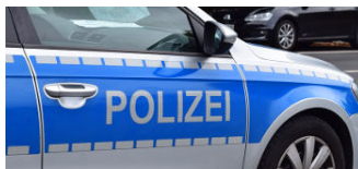
Polizeibericht vom 06.03.2019