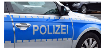
Polizeibericht vom 22.02.2019