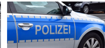
Polizeibericht vom 01.02.2019

Die Tempelhof-Schöneberg Zeitung ist politisch unabhängig und thematisiert Nachrichten aus dem Berliner Bezirk Tempelhof-Schöneberg.