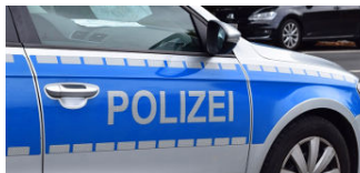
Polizeibericht vom 07.02.2019