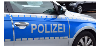
Polizeibericht vom 11.04.2019