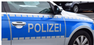
Polizeibericht vom 01.04.2019