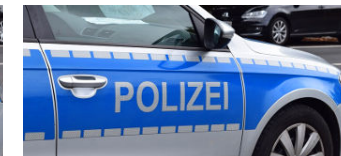
Polizeibericht vom 22.02.2019

Die Tempelhof-Schöneberg Zeitung ist politisch unabhängig und thematisiert Nachrichten aus dem Berliner Bezirk Tempelhof-Schöneberg.