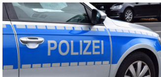
Polizeibericht vom 01.02.2019