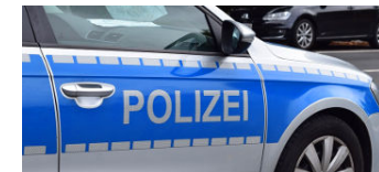
Polizeibericht vom 30.01.2019

Die Tempelhof-Schöneberg Zeitung ist politisch unabhängig und thematisiert Nachrichten aus dem Berliner Bezirk Tempelhof-Schöneberg.