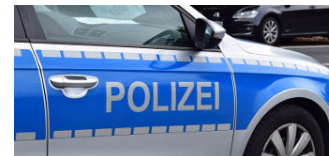
Polizeibericht vom 05.02.2019