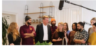
REWE übergibt 100.000 Euro-Spende an „Über den Tellerrand e.V.“