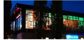
Neue Gastronomie für das Café Haberland gesucht