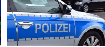
Polizeibericht vom 30.01.2019

Die Tempelhof-Schöneberg Zeitung ist politisch unabhängig und thematisiert Nachrichten aus dem Berliner Bezirk Tempelhof-Schöneberg.