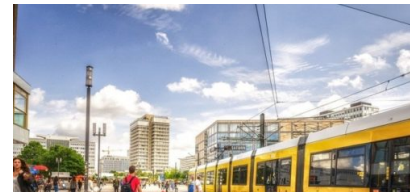
Verbesserungen für den Fußverkehr im Mobilitätsgesetz