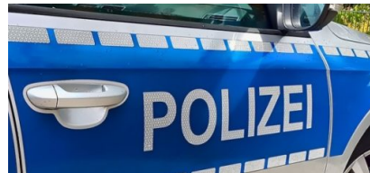
Polizeibericht vom 29.12.2019