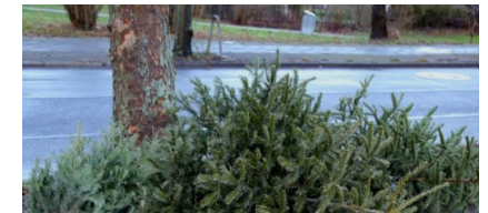
Tschüss Weihnachtsbaum! BSR holt ab!

Die Tempelhof-Schöneberg Zeitung ist politisch unabhängig und thematisiert Nachrichten aus dem Berliner Bezirk Tempelhof-Schöneberg.