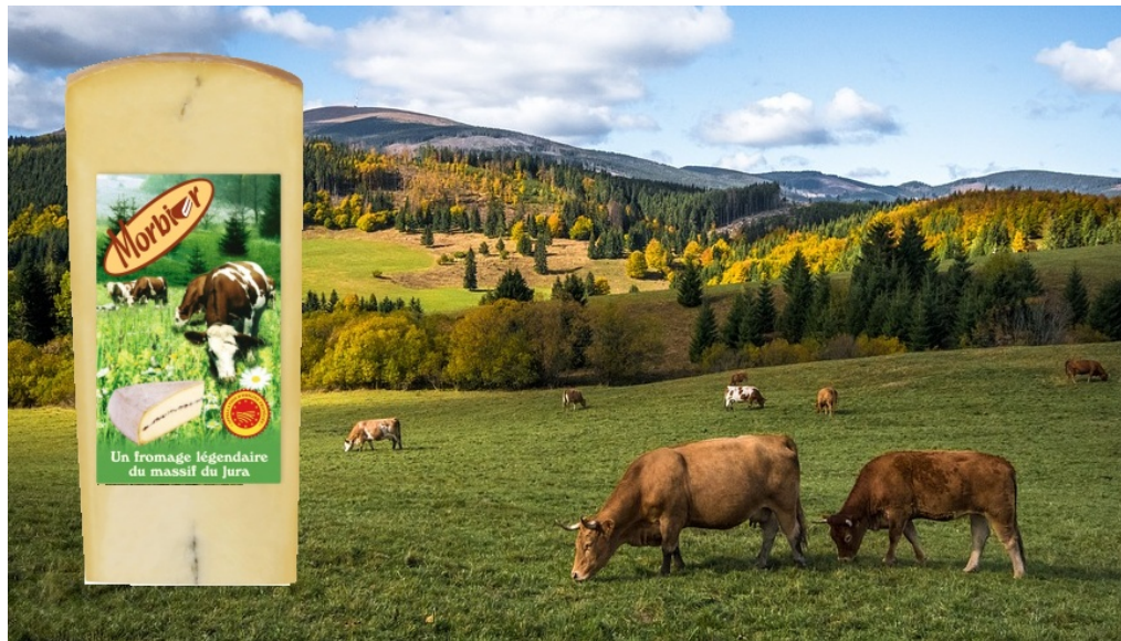
Morbier AOP (Appellation d'Origine Protégée), der legendäre Käse aus dem Jura-Massiv in Frankreich