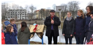
Kinder warnen vor dem „Enten füttern“