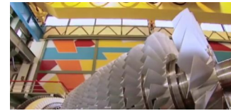
innoBB 2025: Gemeinsame Zukunftsstrategie beschlossen