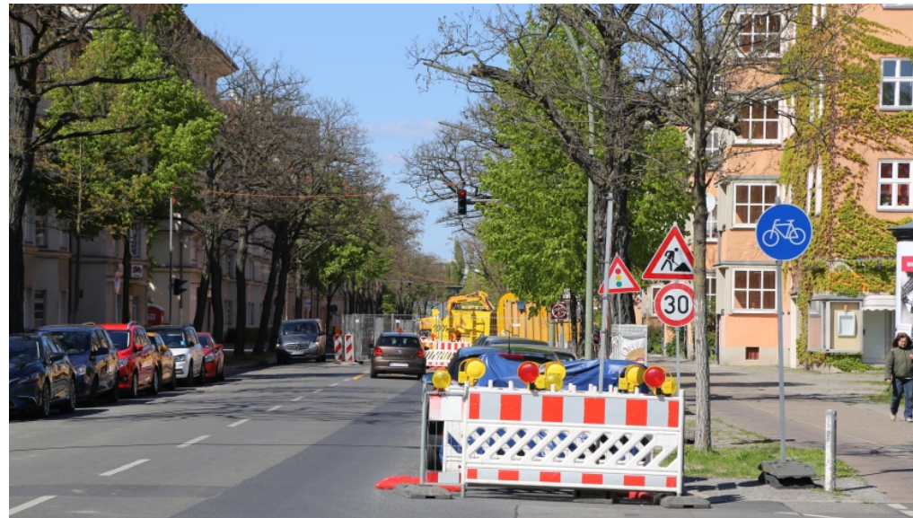
Baustelle Rubensstraße wird am 15.11.2017 aufgehoben

m/s 11. November 2017 Aktuell, Bauen, Slider