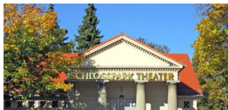
Berliner Bühnen mit erfolgreicher Besucherbilanz 2018