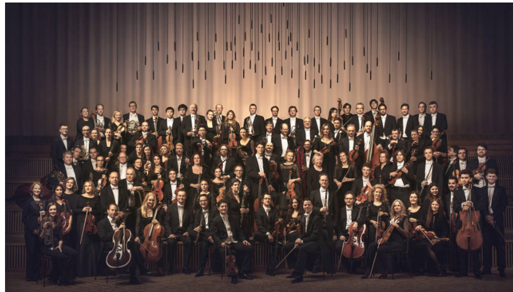
Rundfunk-Sinfonieorchester Berlin