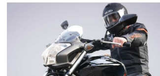
Sicherheitshinweise der Polizei Berlin für Motorradfahrer