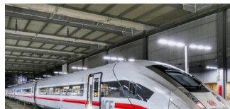
Verkehrsminister will Fernverkehr billiger machen