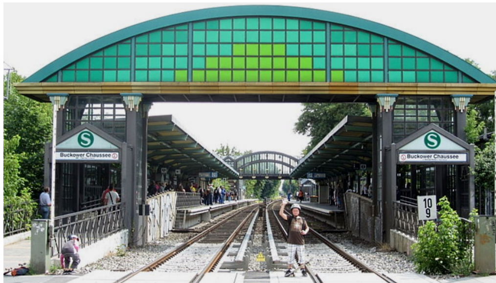
S-Bhf. Buckower Chaussee vom Bahnübergang gesehen