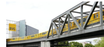
Warnstreik bei der BVG am 15.2.2019