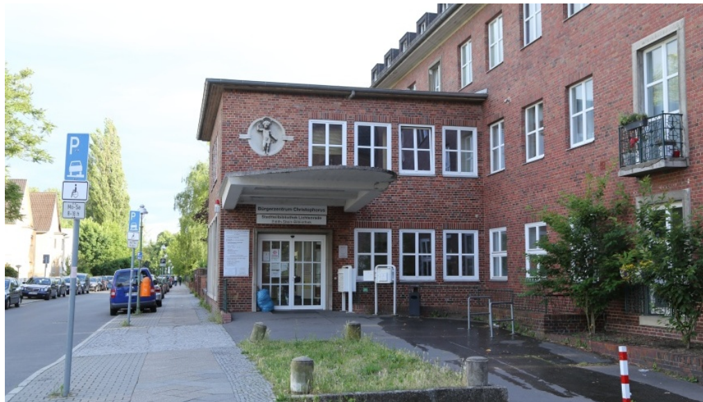
Bürgerzentrum Christophorus, Briesingstraße 6, 12307 Berlin

m/s 🕒 16. November 2017 📁 Bezirk, Bezirkstermine, Slider