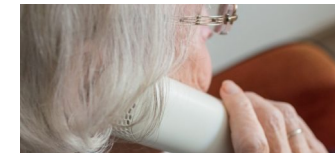
Polizei warnt: „ACHTUNG! Wachsamkeit gefragt!“