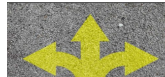
Neuer Werbekodex des Deutschen Werberats