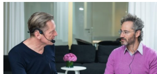
Mathias Döpfner interviewte Alex Karp