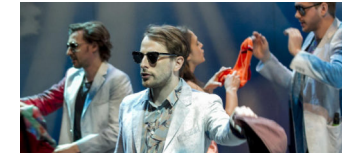
Junges Schauspiel Düsseldorf zu Gast

Die Tempelhof-Schöneberg Zeitung ist politisch unabhängig und thematisiert Nachrichten aus dem Berliner Bezirk Tempelhof-Schöneberg.