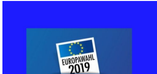
Wahlbezirke zur Europawahl 2019