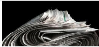
„Und der Berliner Zeitungsmarkt ... Der ist zerstört!“