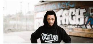
Tschüssy! Berliner Szenelabel gibt auf!