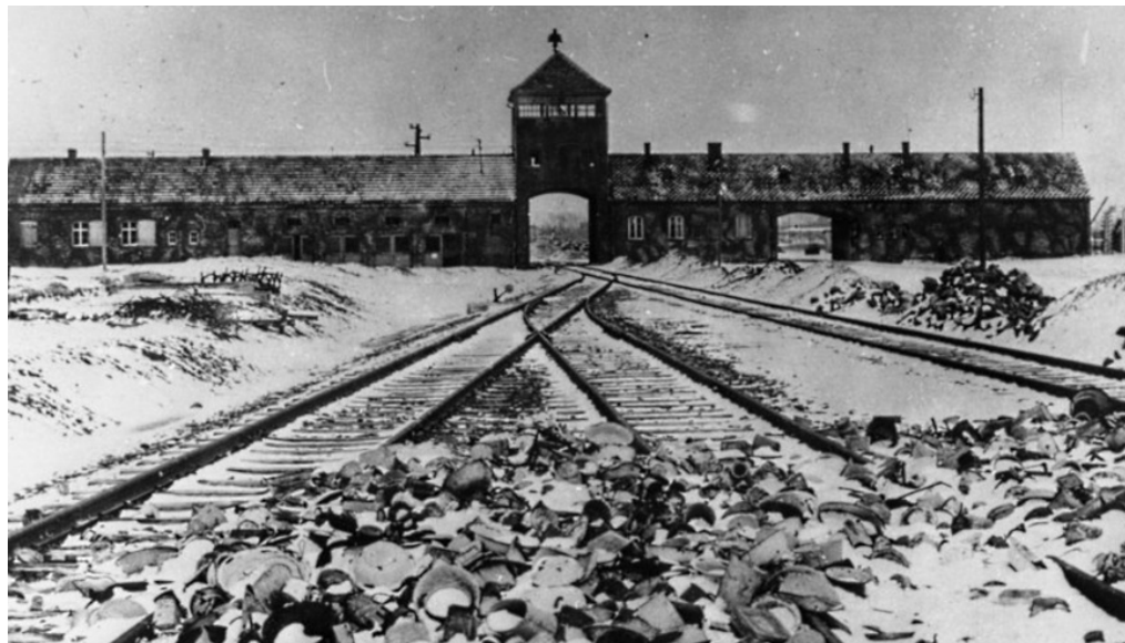
Torgebäude des KZ Auschwitz-Birkenau, Aufnahme kurz nach der Befreiung 1945