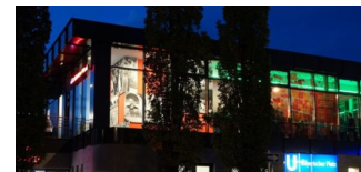
Neue Gastronomie für das Café Haberland gesucht