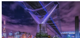
Neue Brücken zwischen London und Berlin