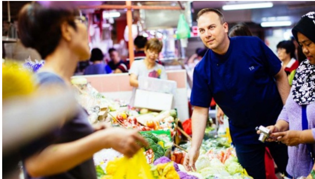
Minister Müller im Flüchtlingslager Dadaab in Kenia

MHS 9. März 2017 📄 Literatur, Slider 📄 🖨️