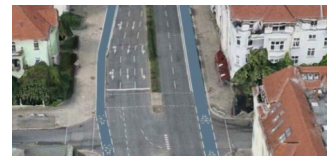
Ideen für den Te-Damm