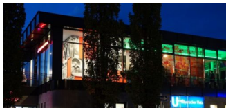
Neue Gastronomie für das Café Haberland gesucht