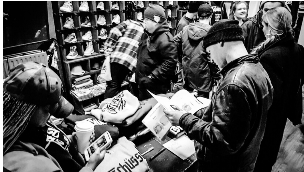
Eröffnungsparty 2017 im LEGACY in der Yorckstraße 53 in Berlin Schöneberg

Seitdem wurden T-Shirts, Hoodies, Sweater, Jogginghosen und Caps mit viel Liebe zum Detail im Graffiti Laden bedruckt und bestickt. Vor allem Kollaborationen mit Tanz Veranstaltungen wie z.B. Cypher Dance Championship und Berlin's Best Dancer Wanted fanden viele Fans. Im Austausch mit Künstlern entstand auch das eigens für Cypress Hill entworfene TSCHÜSSY T-Shirt, das von der legendären HipHop Gruppe auf vielen Stationen ihrer jüngsten Tour in Europa getragen wurde.