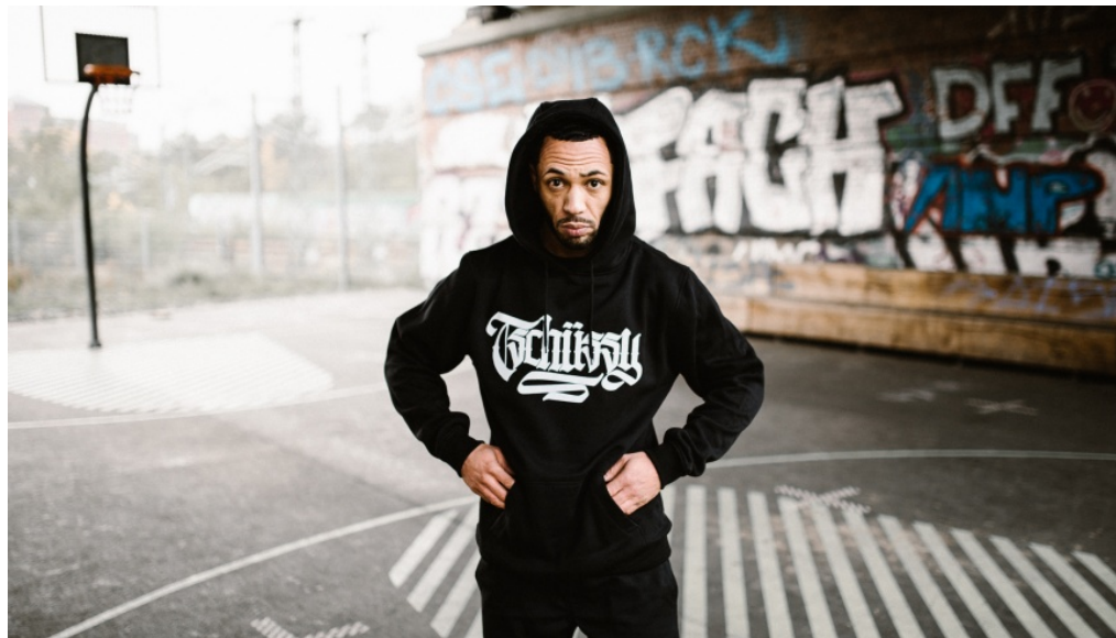
Streetwear Fotoshooting mit TSCHÜSSY Label - Foto: Press Release

Michael Springer 8. März 2019 Aktuell, Kunst und Design, Shopping, Slider